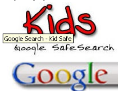
Il Widget per Mac OSX Google Search - Kid Safe

Recentissimo è poi il rilascio del widget Google Search - Kid Safe per la Dashboard dei computer con sistema Mac OSX , scaricabile liberamente all'indirizzo http://www.apple.com/downloads/dashboard/search/googlesearchkidsafe.html , mediante il quale è possibile impostare una ricerca avendo la certezza che il filtro di Google.com sarà attivato al massimo livello.