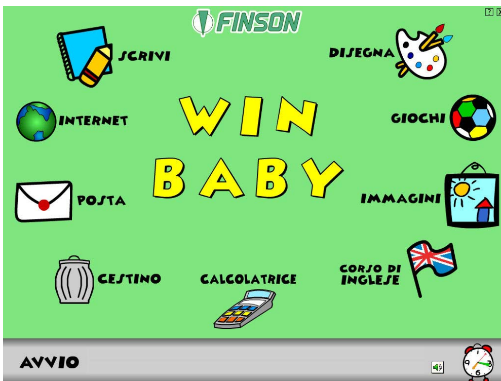
Interfaccia di Winbaby

Questa prospettiva in sé è poco utile per la scuola, dal momento che questa situazione è anzi assolutamente da evitare. Il vero interesse risiede nella proposta anche in questi casi di un'interfaccia globalmente semplificata, che ribadisce un concetto pedagogico di fondo: l'obiettivo dell'ingresso dei computer nella didattica non è addestrare i bambini all'uso fine a se stesso di programmi digitali, ma è piuttosto svolgere con loro attività dotate di senso, e quindi, nella fattispecie, attività comunicative, come la navigazione, la posta elettronica, ma anche scrittura e disegno, facilitate da interfacce semplificate ed intuitive.